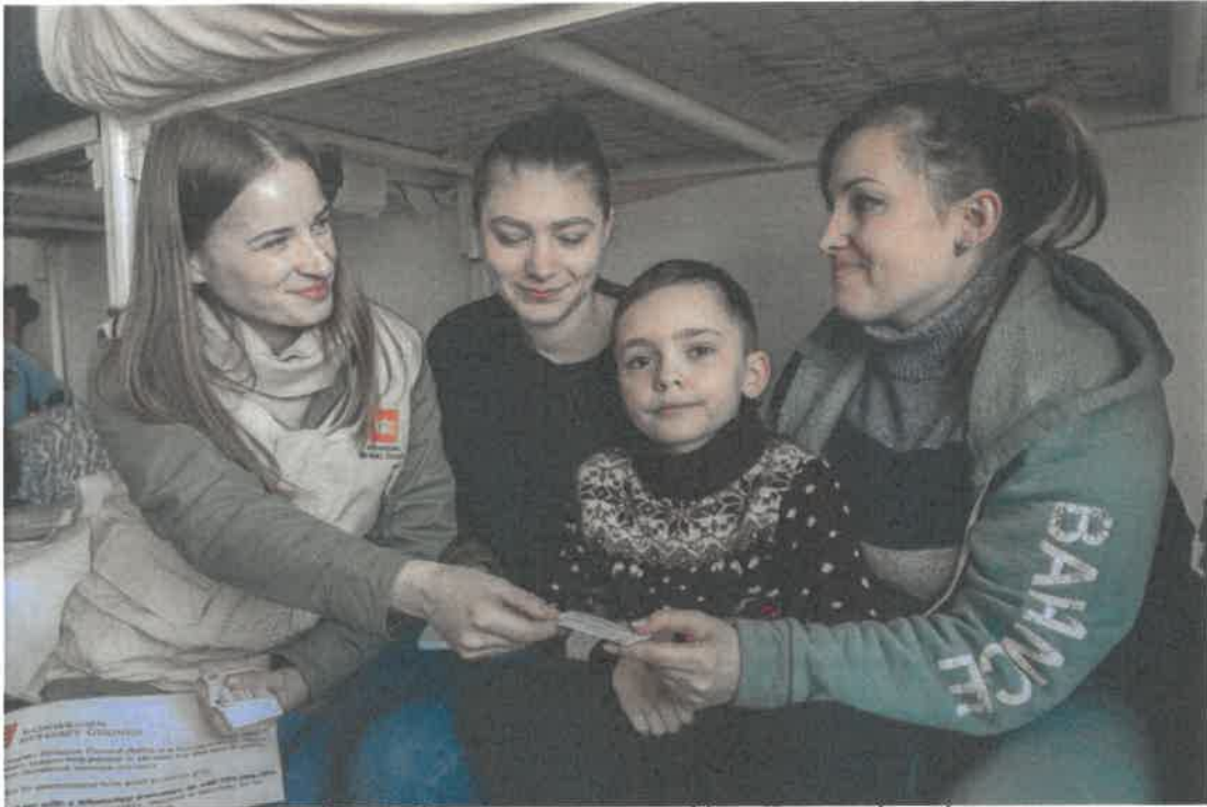
spør blant annet om hva det vil si å være flyktning, og hvilke rettigheter de har, sier Derkach.