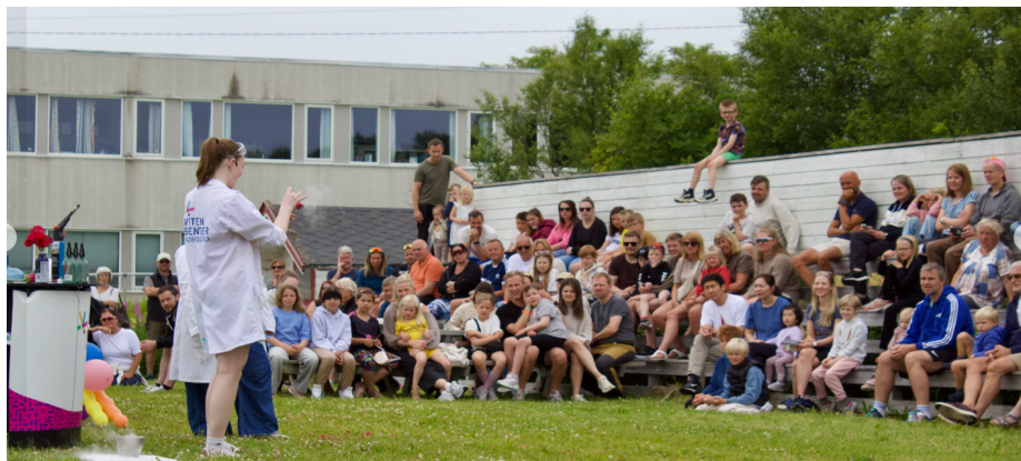
Bilde av Skjærgårdsdagan 2025

Festivalen ble gjennomført ved stor frivillig innsats og bidro til sosialt fellesskap, aktivitet og trivsel i lokalsamfunnet. Arrangementet skapte møteplasser på tvers av generasjoner og styrket både engasjement og bolyst i bygda.