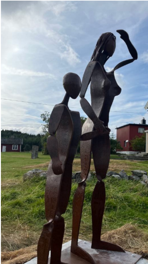
Bilde av Fiskerkonen-monumentet

Dette monumentet vil i lang tid fremover være et samlingspunkt og en kilde til stolthet, og både fastboende og tilreisende vil sette pris på å besøke og minnes lokal historie.