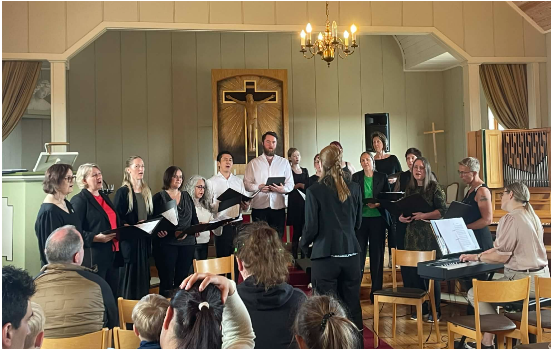
Bilde tatt under korseminaret