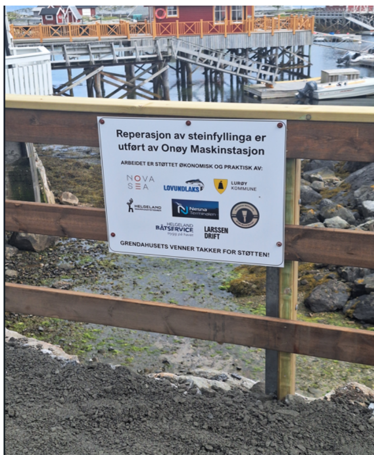
Bilde av steinfyllingen

Med tryggere vei og bedre fremkommelighet vil både beboere og besøkende ha stor glede av et mer robust og sikkert lokalmiljø.