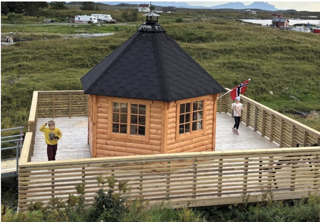
Bilde av grillhytta