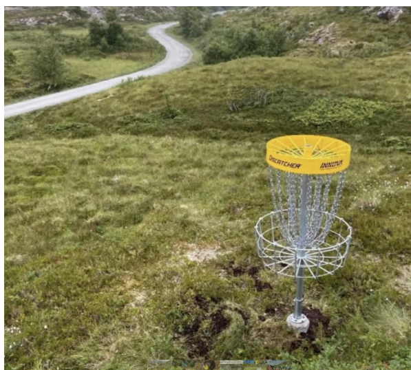
Bilde av Discgolfbanen

Prosjektet har bidratt til økt aktivitet i nærmiljøet og skapt et tilgjengelig tilbud som krever lite utstyr og lave forkunnskaper. Banen er gratis og åpen for alle, og brukes jevnlig av både ungdom og voksne. Tiltaket vurderes som et positivt bidrag til folkehelse, sosial aktivitet og stedsutvikling.