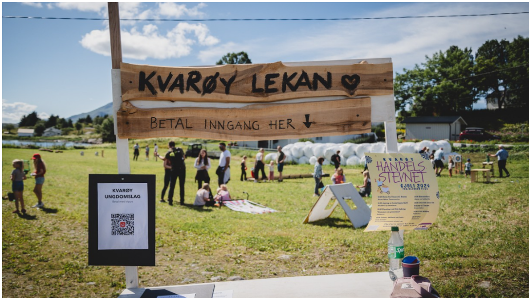
Bilde av Kvarøy Handelsstevne 2025

Arrangørene melder om godt besøk og at de oppnådde målene de hadde satt seg. På lengre sikt vurderes arrangementet å bidra til å gjøre Kvarøy til en attraktiv plass å bo, samtidig som det gir en anledning til å vise frem øya til potensielle nye beboere. Arrangementet bidrar også til å styrke bånd og tilhørighet i lokalsamfunnet.