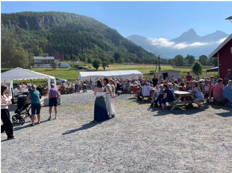
Bilde under Aldersund Sommerfestuka