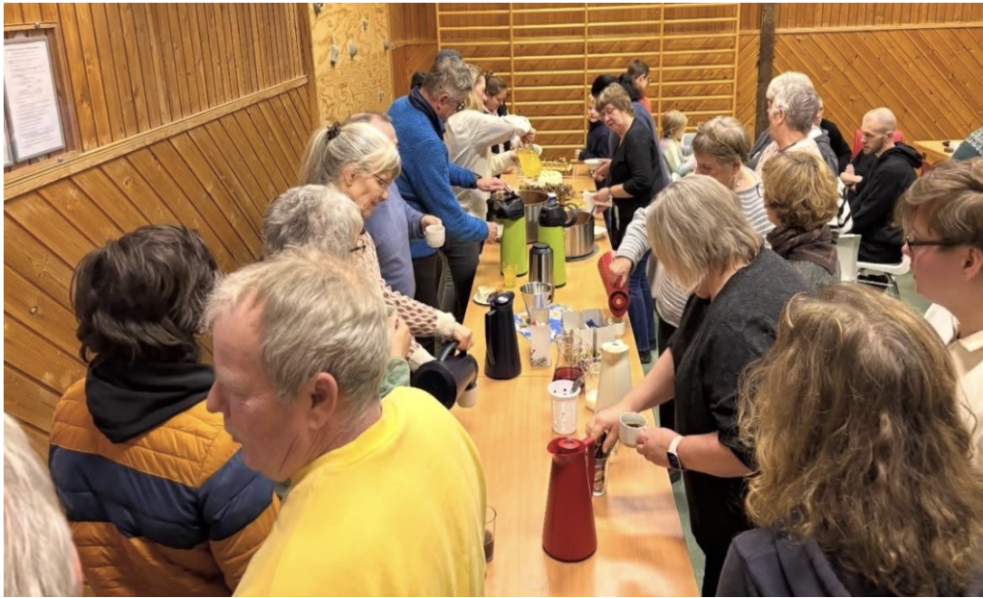
Bilde tatt under en av bygdekveldene