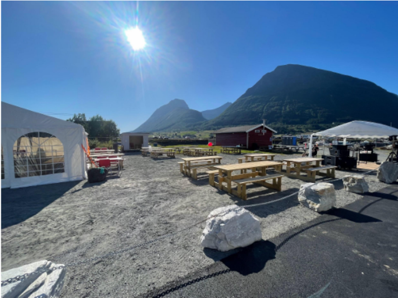
Bilde like før Aldersund Sommerfestuka