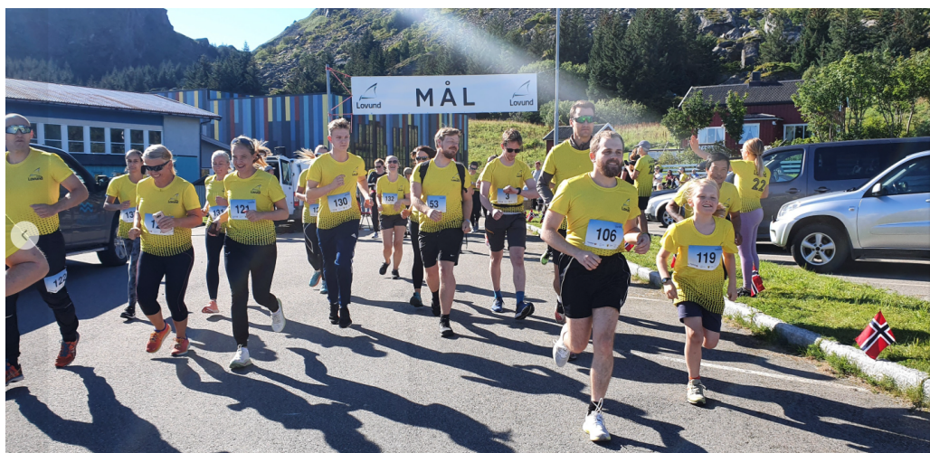
Bilde av Lovundmila 2025

Tiltaket fremmet fysisk aktivitet, folkehelse og sosialt fellesskap på tvers av alder og forutsetninger. Arrangørene trekker frem betydningen av å skape løpe- og aktivitetsglede for alle, samt viktigheten av kommunal støtte til slike inkluderende arrangementer som styrker bolyst og lokal stolthet.