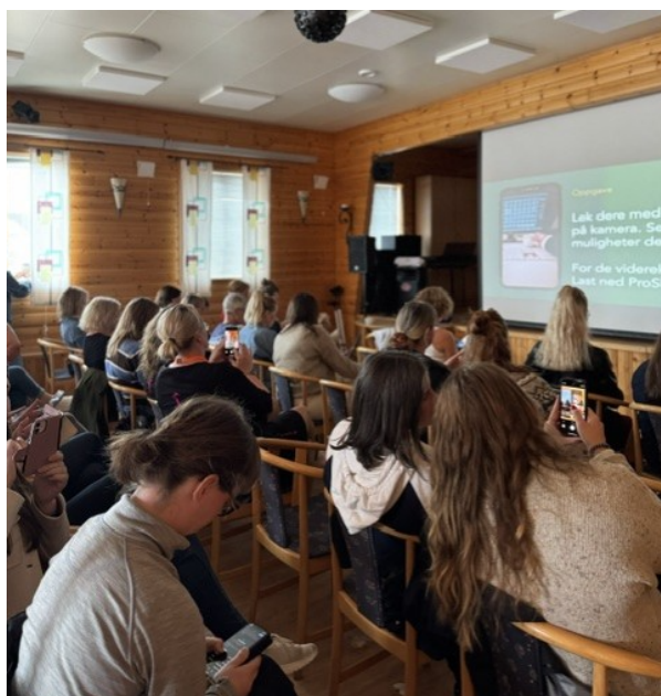
Bilde fra gjennomføringen av «Steinkjerringan»

Selv om det er vanskelig å måle langsiktige effekter av et enkeltstående arrangement, vurderes tiltaket å ha hatt god effekt på trivsel, nettverksbygging og omdømme, samt potensial til å inspirere til lignende initiativ i fremtiden.