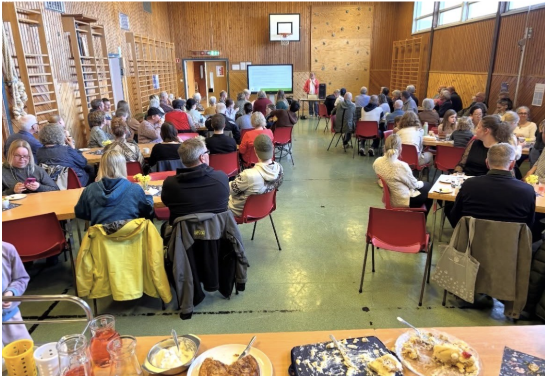
Bilde av bygdekveld