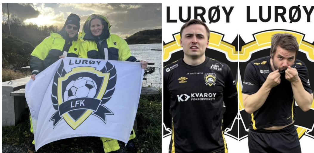
Bilder av Lurøy FK-draktene

De nye draktene har skapt fornyet stolthet i laget, og både spillere og publikum vil glede seg over et mer helhetlig og profesjonelt uttrykk på banen.