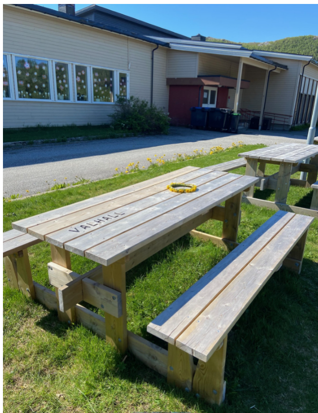
Bilde av benkene

Tiltaket har hatt en positiv effekt ved å legge bedre til rette for sosiale møteplasser og arrangementer i bygda. På lengre sikt forventes det at den økte tilgjengeligheten på sitteplasser vil bidra til hyppigere og mer inkluderende arrangementer, noe som igjen styrker fellesskapet og bidrar til å øke bolysten i området.