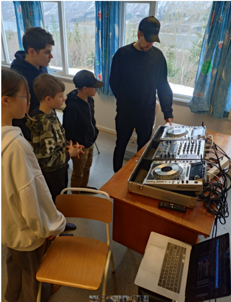
Bilde under DJ-kurset