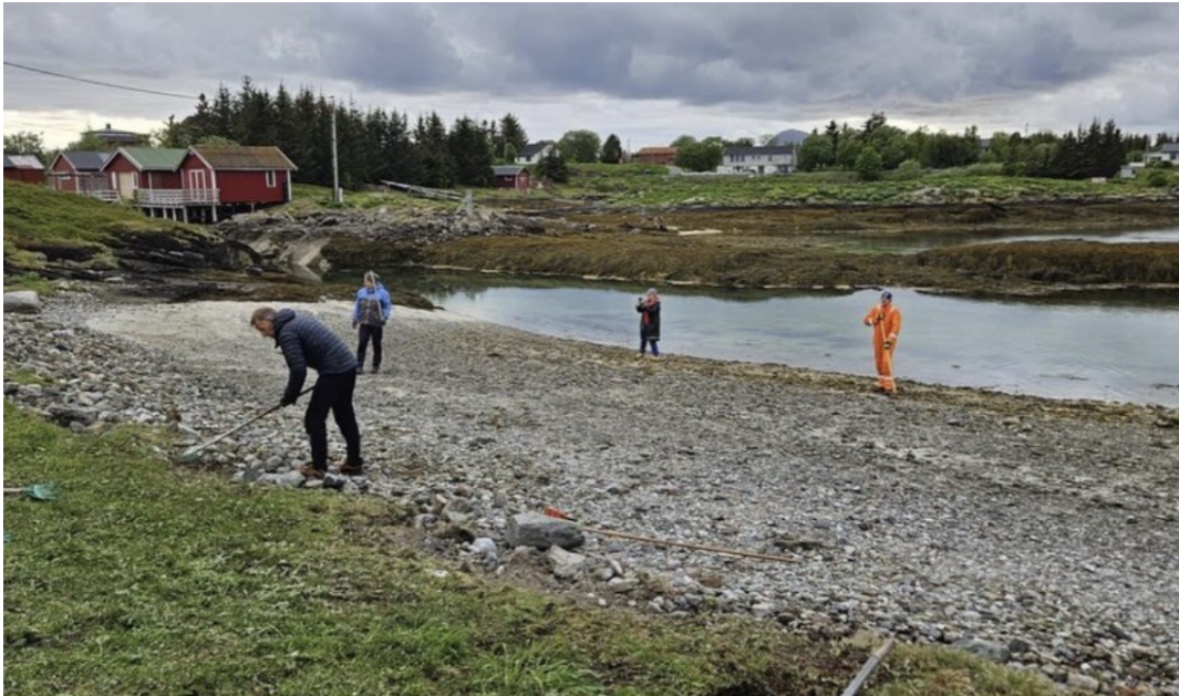
Bilde av opprettelse av badestrand

Bolystgruppen har også arrangert flere bygdekvalder med god oppslutning fra både unge og eldre, med temaer som lokalt foreningsliv, demens, integrering og kulturinnslag. Arbeidet med etablering av badeplass i bygda er startet opp med rydding, avklaringer med grunneiere og utplassering av bord og benker. Videre utvikling av området planlegges gjennom nye dugnader og innsamling av midler.